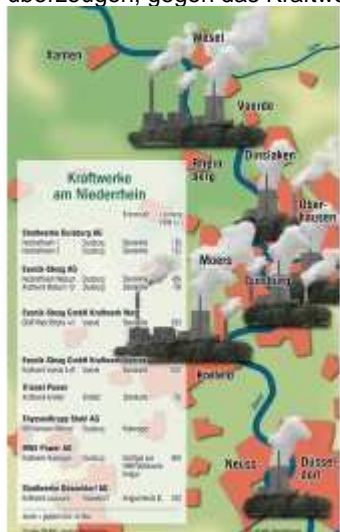
Kraftwerke am Niederrhein