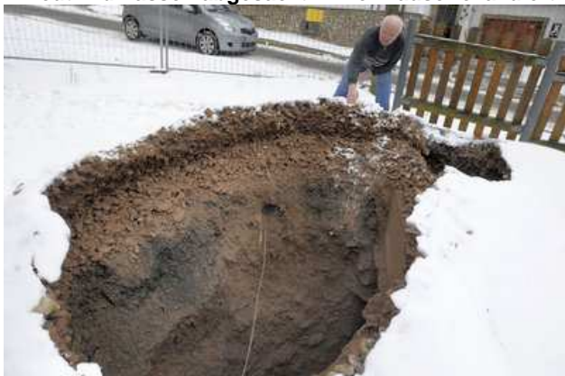
Ein Einwohner schaut in Tiefenort (Thüringen) in einen Krater, der sich an einem Betonpfeiler gebildet hat.

Tiefenort/dpa. In Tiefenort können sie über den Wortwitz wohl nicht mehr lachen: Die Menschen in dem ehemaligen Bergbauggebiet sorgen sich, was in der Tiefe unter ihrem Ort geschieht. Seit acht Jahren sackt in der 4000-Seelen-Gemeinde im Wartburgkreis immer wieder die Erde ein - am Donnerstag zum elften Mal. Laut Lagezentrum im Thüringer Innenministerium entstand ein zwei Meter tiefer Krater. Zwei nahe gelegene Häuser, in denen zwei Familien wohnen, wurden aus Sicherheitsgründen evakuiert.