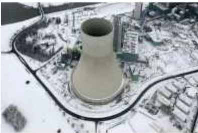
Kraftwerk Walsum

Einen Bedarf für ein solches zusätzliches Kraftwerk, das unter anderem auch Bayer mit Strom beliefern soll, gebe es nicht. „Nordrhein-Westfalen exportiert schon jetzt Energie.“ Statt der Verstromung von importierter Steinkohle – Jansen: „Früher wurde die von Gewerkschaften Blutkohle genannt“ – empfehlen die Gegner trotzdem als Alternative ein Gas- und Dampfturbinenkraftwerk.