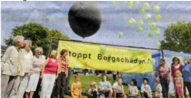
Auf dem Annaberg demonstrieren derweil Bergbaugeschädigte.